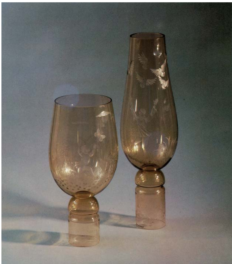
«Под мирным небом» – композиция Ф.Ш. Яхина

Четыре вазы композиции «Иней» изготовлены в 1979 г. выдуванием из дымчатого стекла, отделаны матированием и пескоструйной обработкой (ТОХМ. 124–127).